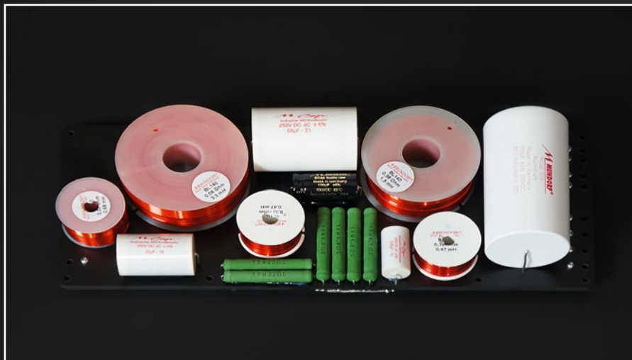
Als Sahnestück wurde innerhalb der Weiche nur mit Nordost-Kabeln gearbeitet. Hier haben wir es mit „nordischer Hochtechnologie“ zu tun, die auch in den legendären Nordost Valhalla Modellen verwendet wird

Die 2,5-Wege-Bauweise ist indessen eine Spezialität von Raidho. Die Konstruktion impliziert, dass beide Basschassis die tiefen Töne, aber nur das obere Chassis die Mitten wiedergibt. Somit lässt sich ein besonders wohldefiniertes und kohärent präzises Klangbild modellieren. Analog zur Premiumbauweise kann sich das Array der überarbeiteten X2t sehen lassen. Für satte Tieftonsensationen sorgen zwei Tantal-Beschichtete 5,25 Zoll Tieftöner. Sie ahnen es bereits, das „t“ hinter X2 steht für diesen Materialeinsatz. Tantal ist ein sogenanntes Refraktär-Metall. Diese Klasse zeichnet sich durch ihre besonders hohe Widerstandsfähigkeit gegen Hitze und Verschleißerscheinungen aus. Analog dazu besitzt Tantal mit 2996 Grad Celsius den vierthöchsten Schmelzgrad aller Metalle des Periodensystems. Durch die Beschichtung wird die Trei-