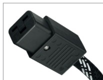
AC-2502 | C19