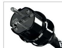
AC-2502 | SCHUKO