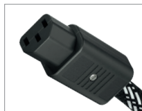
AC-2502 | C13